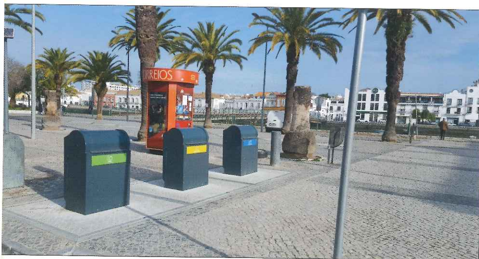
Ilha de contentores subterrâneos em Tavira

Sim. Somos certificados na Gestão da Qualidade desde 2008. Atualmente somos já certificados pelo referencial ISO 9001:2015. A opção da empresa em certificar o Sistema de Gestão de Qualidade pela norma ISO 9001 reforça a garantia de um elevado nível de qualidade no fornecimento de produtos e serviços aos seus clientes e partes interessadas. Pretendemos em breve certificar a empresa também noutras áreas, como a Segurança no Trabalho e o Ambiente. ◀