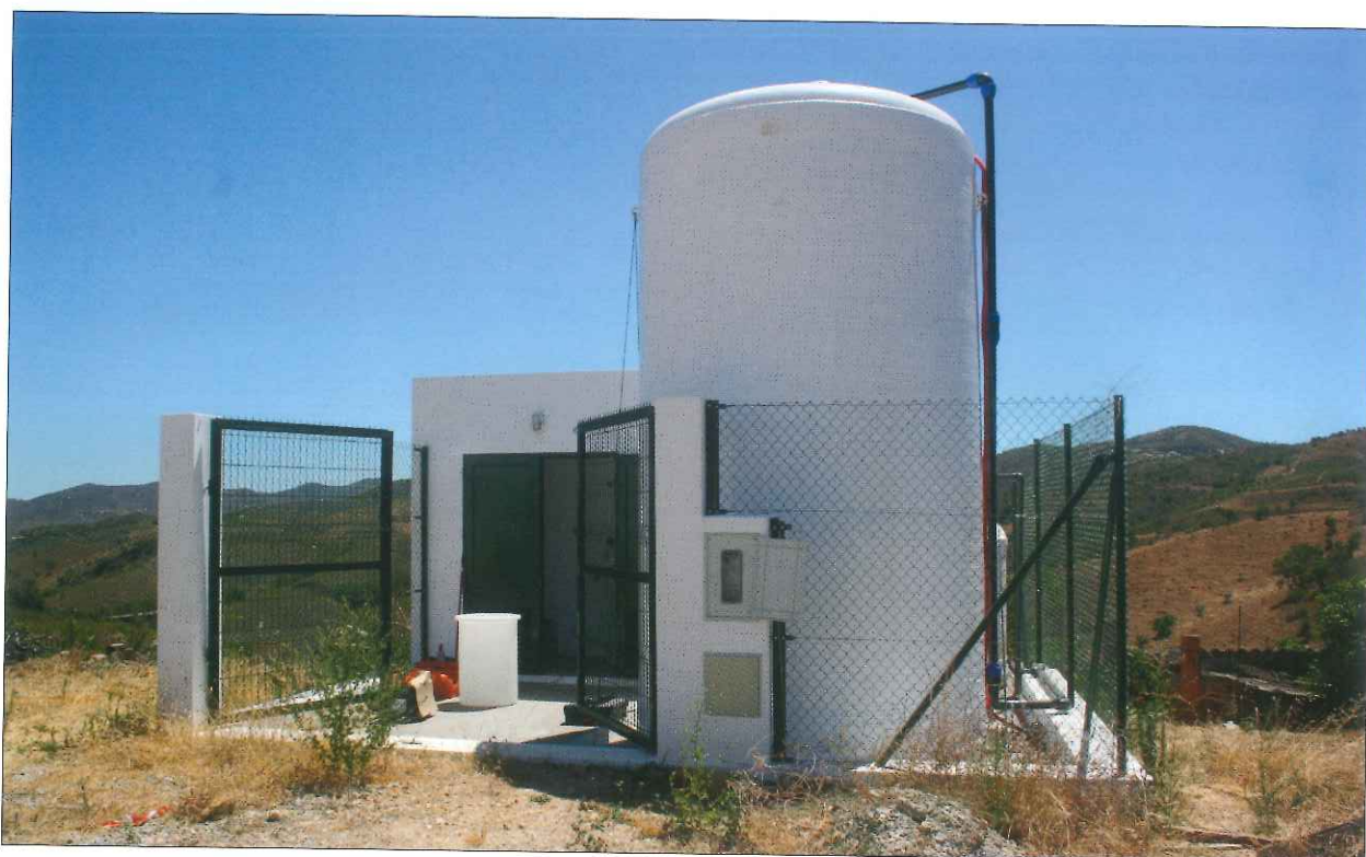
ETA e depósito de água dos Relvais

2017, as análises do PCO representaram cerca de 85% do total das 7786 análises realizadas. Este controlo é mais abrangente nas ZA com origens próprias, pois permite-nos determinar variações na qualidade das origens (captações) e assim adequar os sistemas de tratamento a essas variações. Pontualmente podem surgir resultados analíticos acima dos valores de-