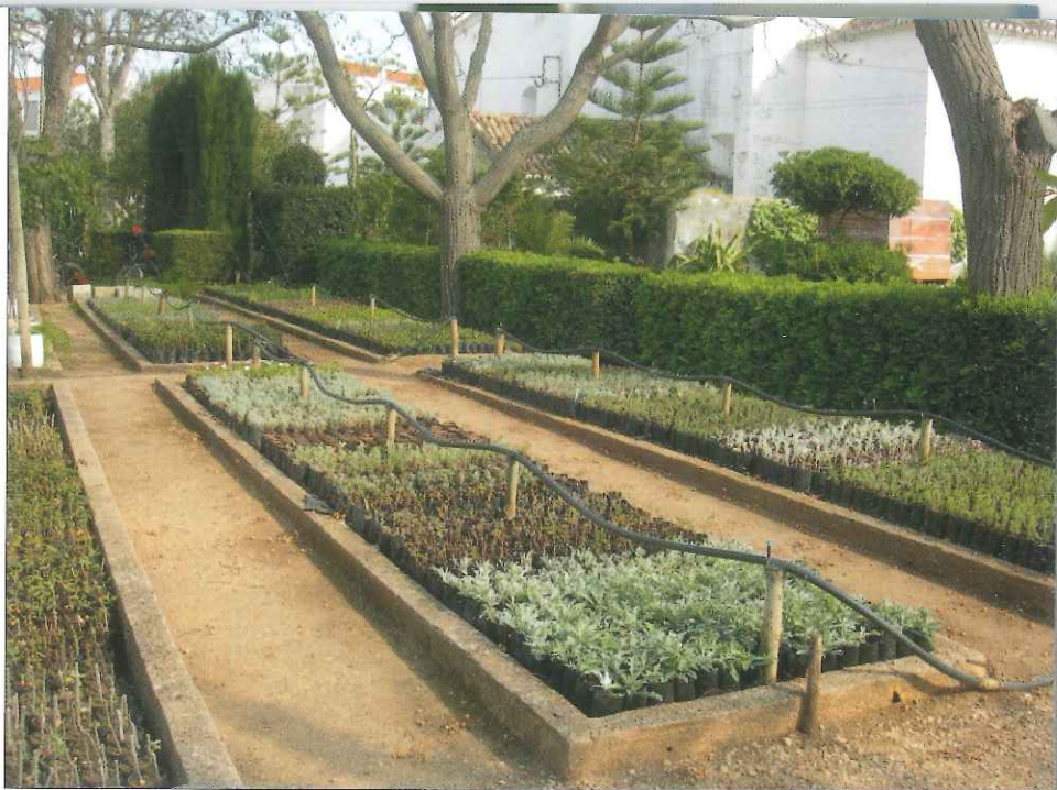
Viveiros em Tavira

A Taviraverde tem sido sempre distinguida pela ERSAR com os selos de qualidade exemplar de água para consumo humano, pelos seus excelentes resultados nesta matéria e por cumprir largamente todos os critérios definidos para a sua atribuição. O fato de termos sempre taxas de cumprimento dos VP acima dos 99% deve-se ao trabalho que é feito diariamente para assegurar a vigilância adequada a todas