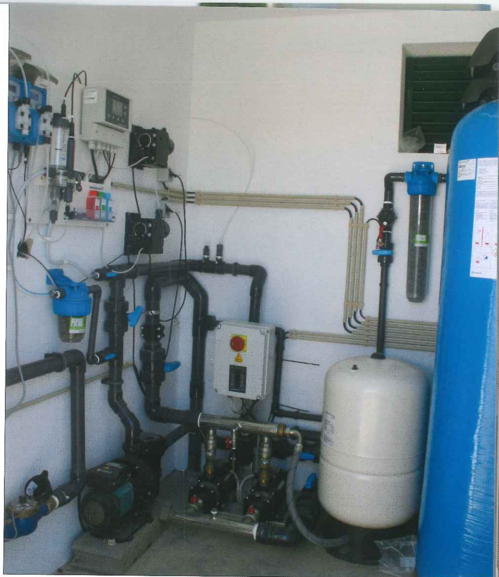
ETA dos Relvais na Serra de Tavira

Temos atualmente cerca de 85% de cobertura no abastecimento de água em todo o concelho, tendo havido, desde a criação da Taviraverde em 2005, uma grande