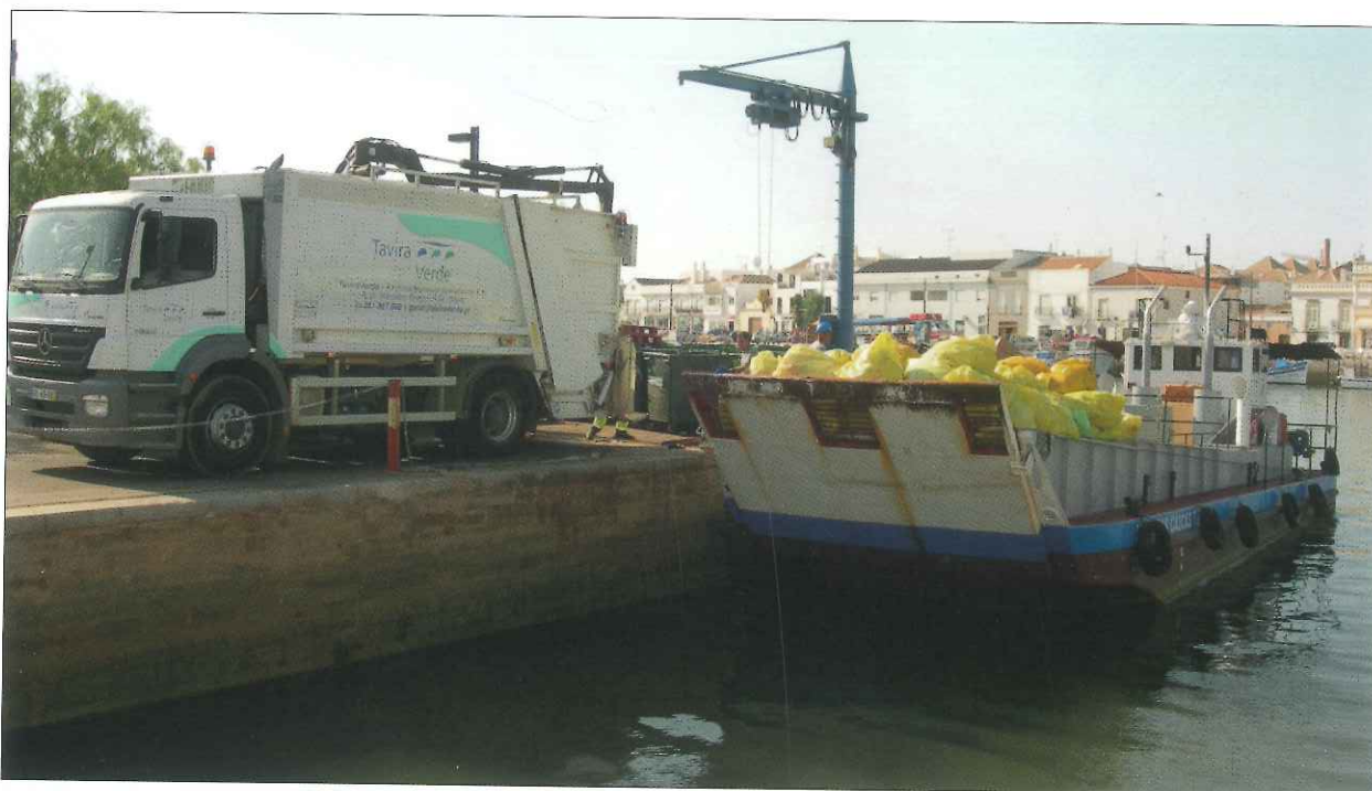
Recolha de resíduos na Ilha de Tavira

apresentadas e aprovadas pelo POSEUR – Portugal 2020: Programa Operacional da Sustentabilidade e Eficiência no Uso de Recursos, com uma taxa de financiamento de 85%.