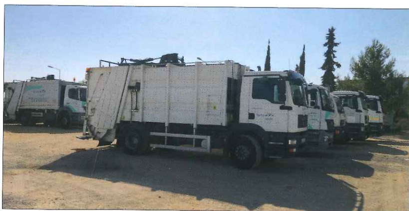
Veículos de recolha de RSU

Estamos constantemente a fazer investimentos quer em manutenção das redes e equipamentos existentes quer em novas redes e novos equipamentos. Claro que a prioridade é sempre o abastecimento de água às populações, garantindo sempre a boa qualidade e quantidade do produto entregue. Para além de diversas pequenas obras de manutenção/remodelação e melhoria das redes existentes, atualmente temos sete grandes obras a decorrer no nosso concelho, sendo três de saneamento e quatro de abastecimento de água, que representam um valor total de investimento de cerca de 2.400.000 (dois milhões e quatrocentos mil euros). Claro que só nos é possível realizar estes investimentos com recursos a fundos europeus. Neste caso foi no âmbito de candidaturas